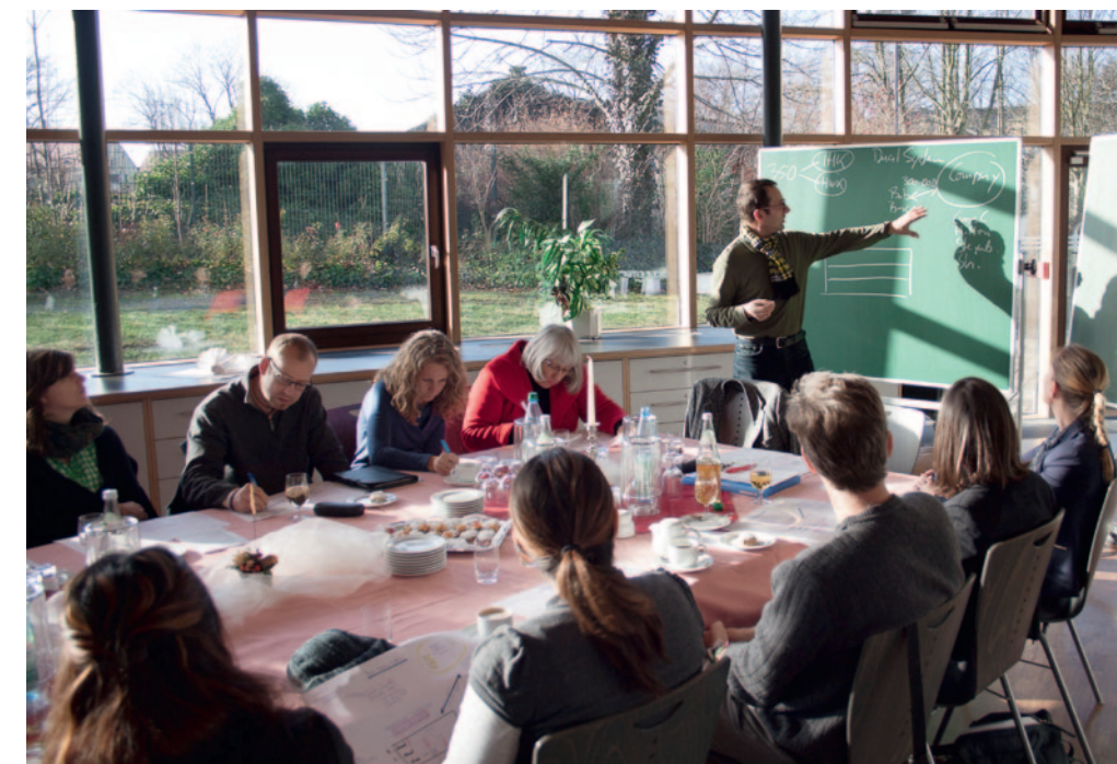
unten Besuch einer Leipziger Berufsschule