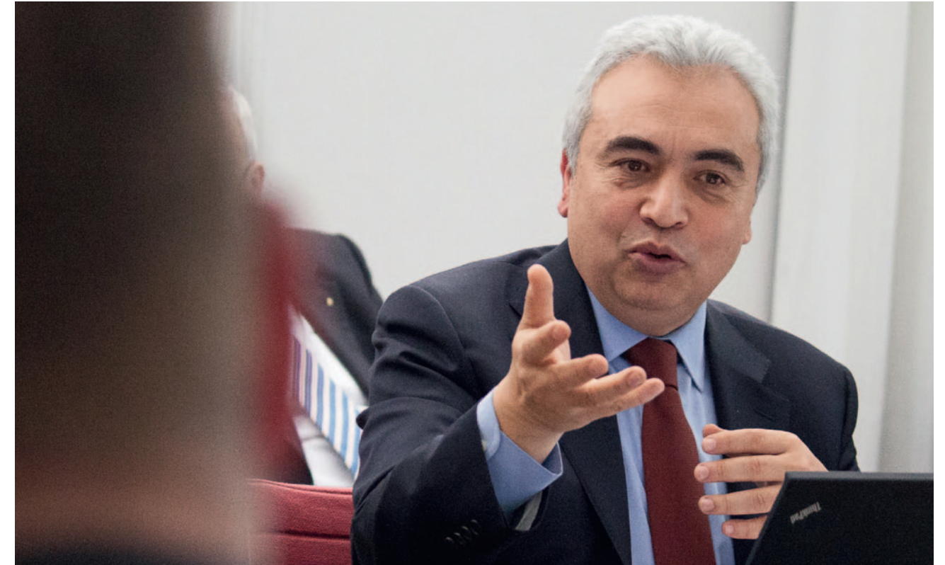
oben Fatih Birol

Auch dieses Problem könne nur durch gemeinsames entschlossenes Handeln verändert werden. In der anschließenden Debatte wurden verschiedene Aspekte des Vortrags vertieft, darunter die Frage nach der Zukunft der fossilen Energien einerseits und erneuerbaren Energien andererseits, sowie die Zukunft des Fracking und die Ölpreisentwicklung.