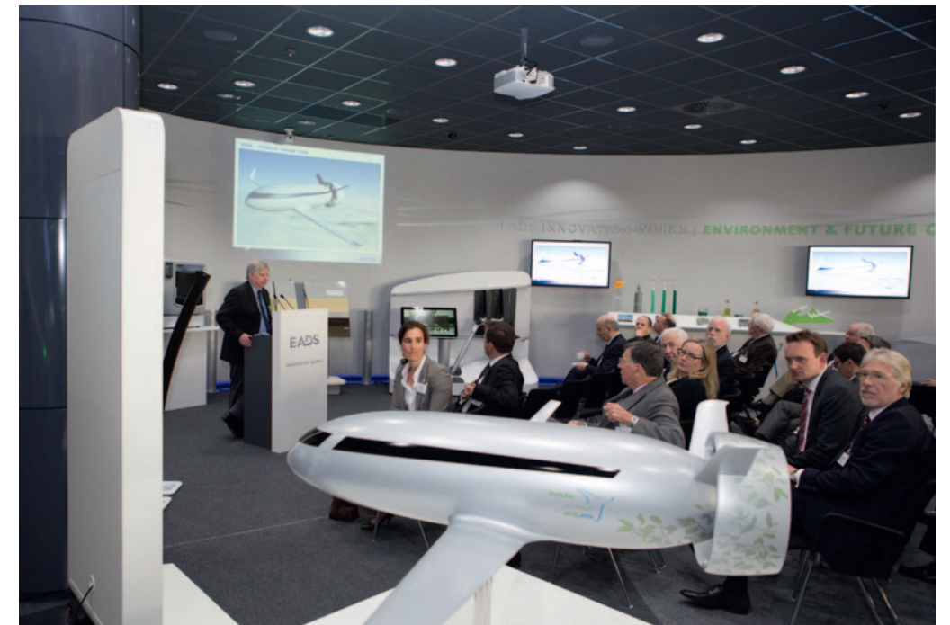
unten Zu Gast bei EADS Deutschland GmbH - Innovation Works in Ottobrunn