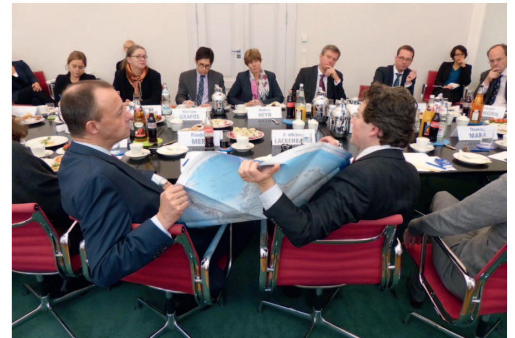
unten Die Teilnehmer des Arbeitskreises Kanada