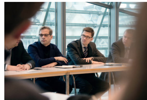
oben links Stefan Liebich, Christian Hirte