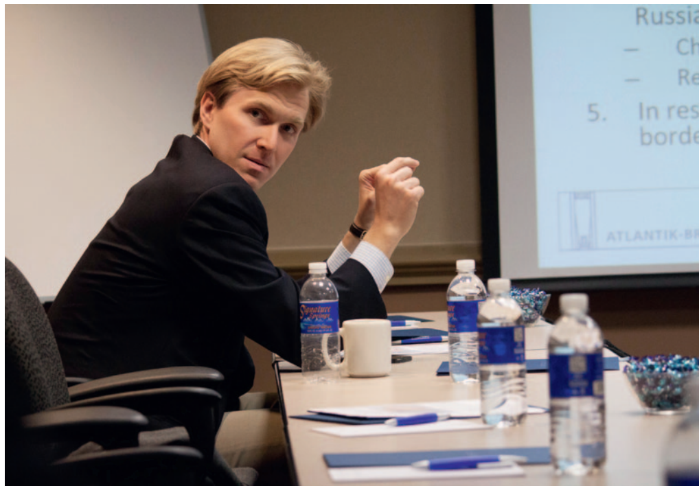
Bild Seite 109 Young Leaders-Alumni in Leesburg