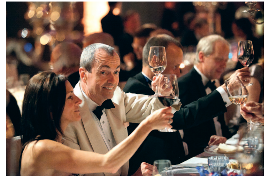
unten Tammy Murphy, Philip D. Murphy, Friedrich Merz, Tom Buhrow