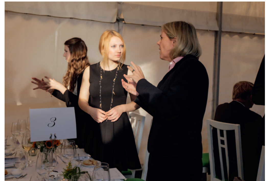
unten Ausklang des Abends im Garten des Magnus-Hauses