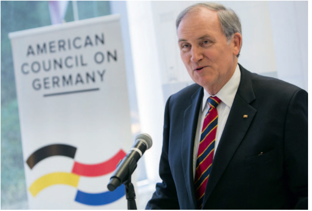
unten Robert M. Kimmitt