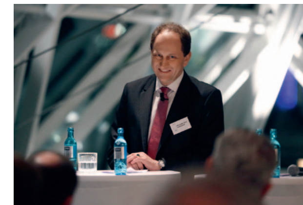
oben links Alexander Graf Lambsdorff, Karel De Gucht, Friedrich Merz