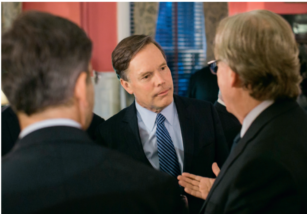
oben R. Nicholas Burns