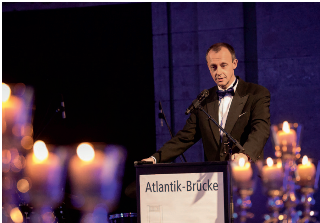
oben Friedrich Merz