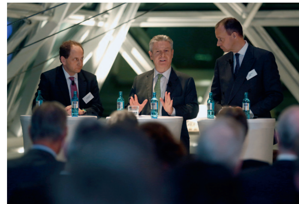
unten Alexander Graf Lambsdorff, Karel De Gucht, Friedrich Merz