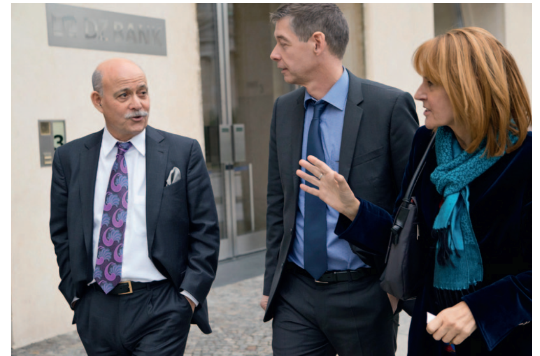
Interview mit Jeremy Rifkin