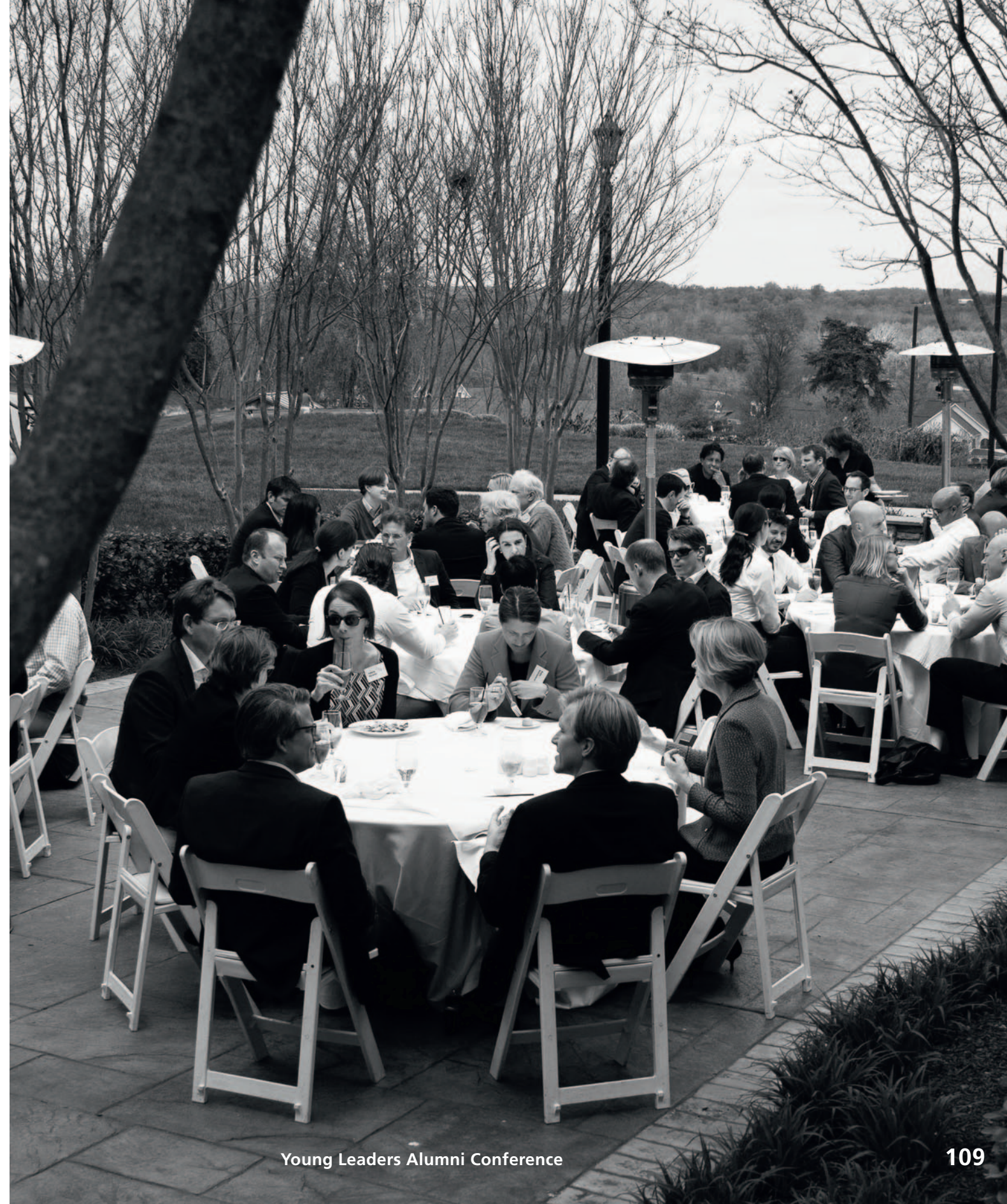
Young Leaders Alumni Conference