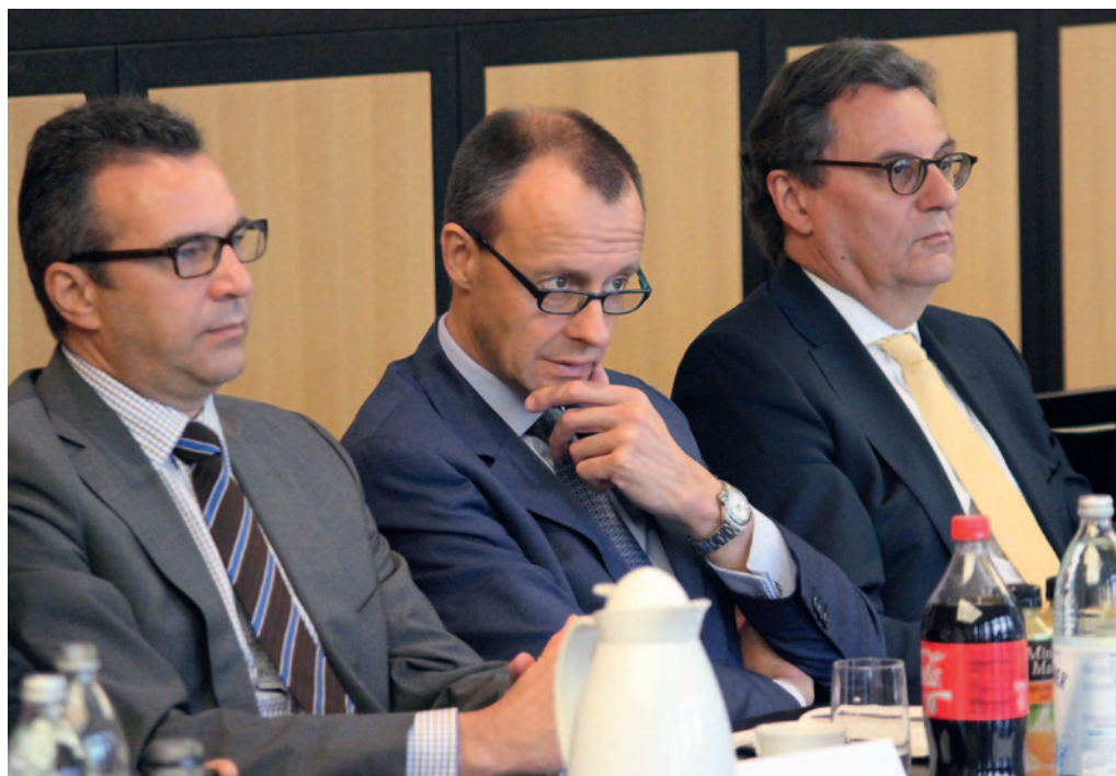
oben Joachim Pfeiffer, Friedrich Merz, Hans-Joachim Otto