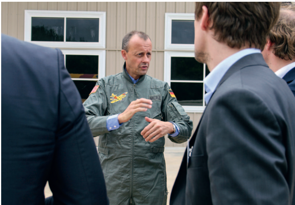
oben Friedrich Merz