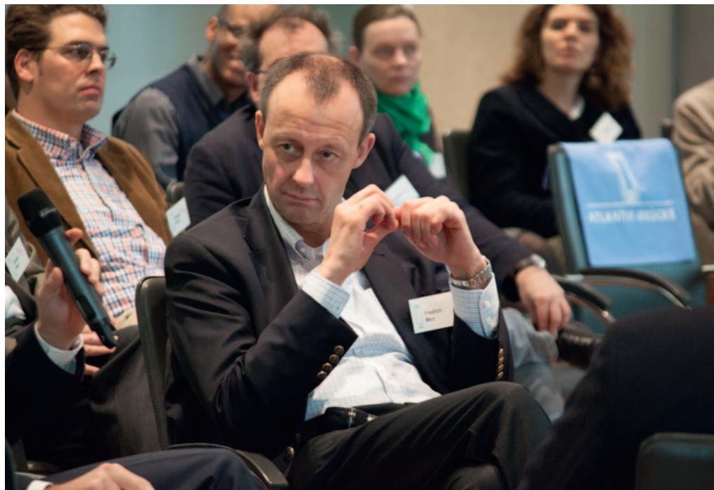
links Friedrich Merz

Am 18. Januar 2014 kamen über hundert Young Leaders-Alumni am Starnberger See zur diesjährigen New Year's Reunion, um alte Freunde wiederzusehen, neue Kontakte zu knüpfen und über transatlantische Themen zu diskutieren. Bei einer Debatte über die Auswirkungen der NSA-Affäre auf das europäisch-amerikanische Verhältnis konnten die Alumni Meinungen austauschen und neue Perspektiven auf das kontroverse Thema erhalten. Young Leader-Alumnus Kai Diekmann, Chefredakteur der Bild, berichtete im Gespräch mit Friedrich Merz über die Eindrücke und Erfahrungen während seines Aufenthaltes im Silicon Valley.