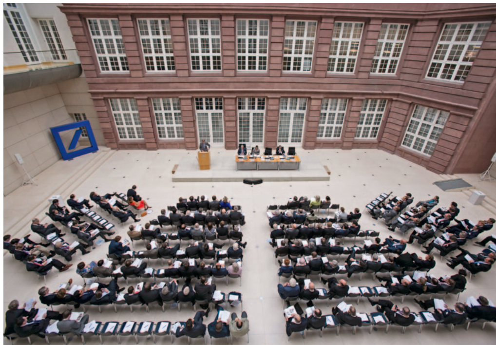
oben Mitgliederversammlung im Atrium der Berliner Repräsentanz der Deutschen Bank