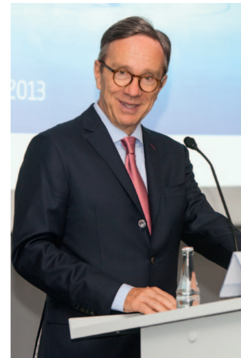
oben rechts Robert M. Kimmitt