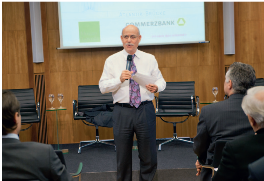
links Jeremy Rifkin